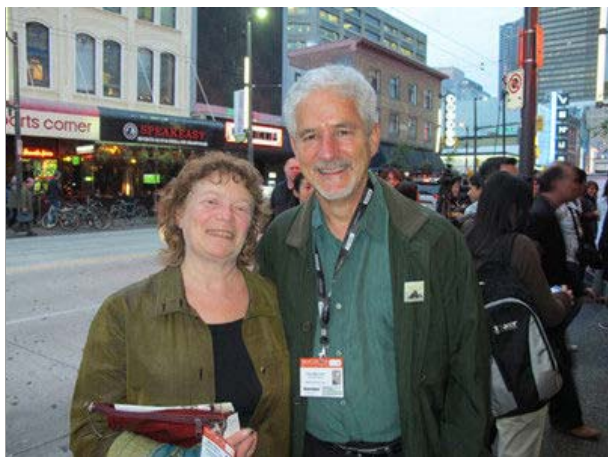
第30届温哥华国际电影节

http://www.sina.com.cn 2011年10月11日10:48 环球华报