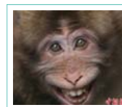
黄山短尾猴展现笑容

喝咖啡减肥:瘦!瘦!瘦! 【颈椎病】轻松解决 白发-脱发-解决有妙招 让女人满足的9大绝招 4-5岁前停经不正常! 如何祛4条最显老皱纹